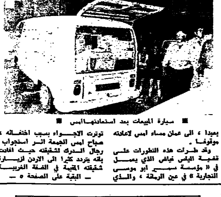
سيارة المبعث بعد استمناها امس

هذا هو الحل الذي توصل اليه الرئيس الكافر رشيد كرامي ، وبعد عدة طويقة من البحث في ازالة العقدة والمرافق التي تعترض مهمته . وقد تولى الرئيس سابق سلاما شرح هذا الحل في تصريح جاء فيه : ان الحكومة المطلوبة اليوم هي حكومة تحول دون استمرار حكم العسكريين اولا ، وثانيا من اجل اجراء حوار اخرى بناء على جميع الفروقات . واضاف سلام : وفي اعتراف انا يجب ان نتفق جميعا ، وفيه ليس من الضروري اليوم ، وفي الظروف التي نحتارها ، ان نؤخر اجراء هذا الحوار ، قبل تلافى الحكومة التي تدعو اليها ، بل ان نخطى هذه القضية ، ونجمل من الحكومة المقبلة نفسها ، الادارة الصالحة لهذا الحوار في الفروقات اللبنانية ، وبينهم وبين اخوانهم الفلسطينيين . التيه على ص ١٢ - عمود ٣ و ٢